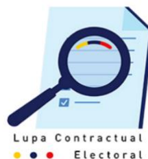
Lupa contractual electoral