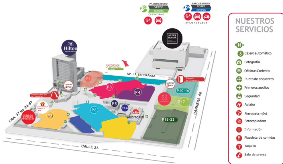
Figura N.º 1. Imagen de referencia de Corferias

También debe proveer soporte eléctrico permanente, asistencia continua frente a diferentes tipos de eventualidades, seguridad perimetral en el recinto, con control de accesos y vigilancia en puntos estratégicos y sistema de video vigilancia (CCTV) activo para monitoreo en tiempo real.