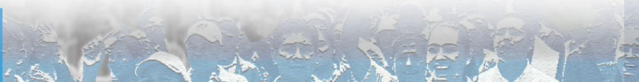
Imagen N° 6. Cámara de Representantes Circunscripción Territorial, tipos de ingresos y gastos reportados -Corte Marzo 25 de 2026-

En suma, las candidaturas que resultarían electas en la Circunscripción Territorial muestran un cumplimiento alto del reporte financiero (81,37%), con erogaciones relevantes y bien diversificadas —especialmente en propaganda electoral (que representa más del 47% del total de gastos reportados)—, y una financiación basada principalmente en aportes personales y contribuciones particulares. El subregistro residual afecta al 18,63% de los electos (30 personas), lo que limita la trazabilidad completa en esas listas y genera una preocupación por posibles omisiones en la rendición de cuentas de quienes asumirán curules territoriales.